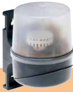
DÄ 565 15