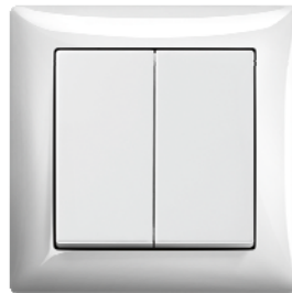
Serienschalter Farbe: alpinweiß (-914), ähnlich RAL 9010