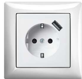
SCHUKO® USB-Steckdose Farbe: alpinweiß (-914), ähnlich RAL 9010