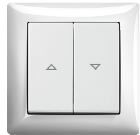
Jalousieschalter Farbe: alpinweiß (-914), ähnlich RAL 9010