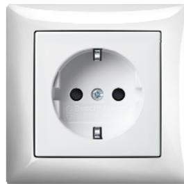
Steckdose mit integriertem erhöhtem Berührungsschutz Farbe: alpinweiß (-914), ähnlich RAL 9010