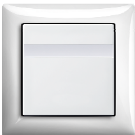
Busch-Komfortschalter Farbe: alpinweiß (-914), ähnlich RAL 9010