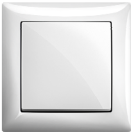
Schalter/Taster Farbe: alpinweiß (-914), ähnlich RAL 9010